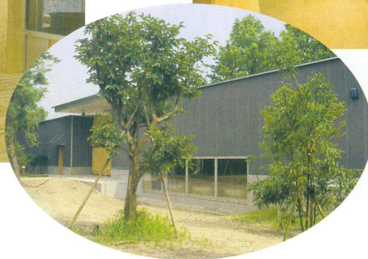
「有機（オーガニック）空間」 菊水日本酒文化研究所 (新潟県新発田市)